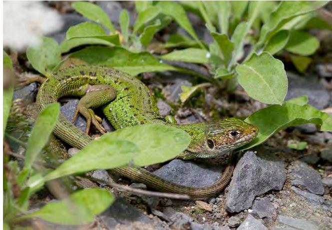
Gewone bronlibel (links) en Westelijke smaragdhagedis.

We waren uitgekeken op de omgeving en besloten 2 augustus verder naar het zuiden af te zakken naar de rivier de Tarn. We kwamen uiteindelijk uit bij Ispagnac (N 44° 22' 13", E 3° 32' 08") in de Cevennen. De rivier de Tarn heeft hier snelstromende, maar ook veel bredere vrijwel stilstaande delen. Direct na het installeren op de camping (er zijn er veel daar) zagen we een Gewone bronlibel eieren afzetten en vlogen er zeker vijf mannetjes rond. Ze lieten zich goed fotograferen en kwamen zelfs op onze benen zitten.