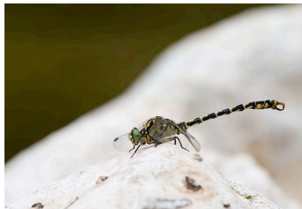
Kleine tanglibel ssp. forcipatus .