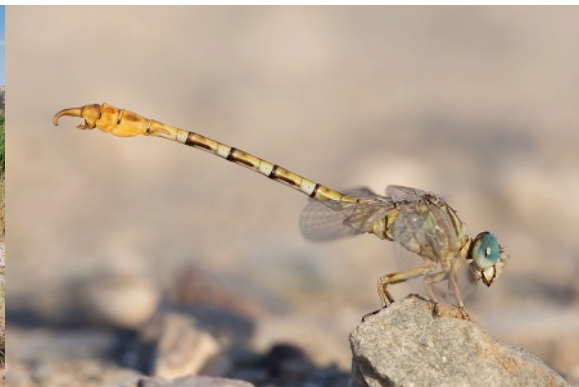
Gestreepte haaklibel (man)