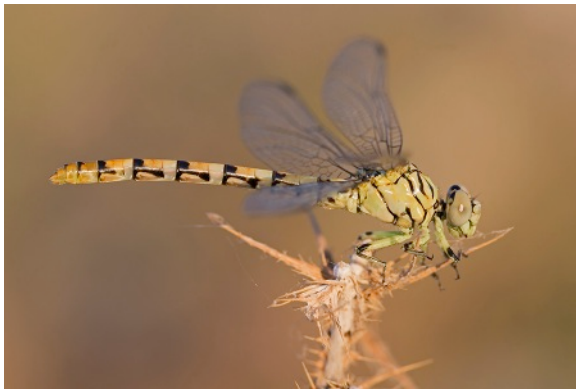
Vale tanglibel (vrouw)

Na het uitzoeken en het maken van een back-up zijn we naar het riviertje Caraçay aan de rand van Osmaniye gereden om die eens te onderwerpen aan een odonatologisch onderzoek. Het resultaat was meer dan 10 mannetjes en 3 vrouwtjes van de Vale tanglibel. Het vrouwtje was weer een nieuwe voor ons. Verder veel Purperlibellen, Ivorenbreedscheenjuffers en Kleine oeverlibel. Toen het donker werd weer terug naar het hotel voor een goede nachtrust.