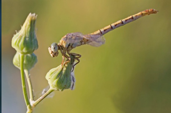
Gestreepte haaklibel (vrouw)

's Middags zijn we om 5 uur de hitte ingetrokken voor de eerste verkenning van het gebied. We waren de auto nog niet uit of ik zag al een Vaandeldrager vliegen. Uiteindelijk 11 van deze mooie dieren gevonden. Prachtige foto van kunnen maken met zwart water op de achtergrond. Ook zag ik nog een romboutje zitten. Dat bleek een vrouwtje Gestreepte haaklibel te zijn! Een leuke waarneming omdat het vrijwel altijd mannetjes zijn die worden gezien. Verder zitten er honderden Mantelgrondlibellen en Lantaarntjes, zeker 5 Zuidelijke keizer en 1 Gewone keizerlibel gezien. Verder lantaarntjes I. evansi de Afrikaanse tegenhanger van ons lantaarntje I. elegans .